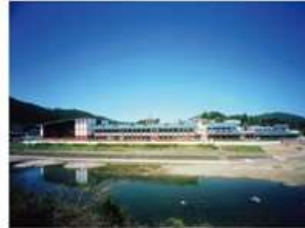
(旧)京北第一小学校

京北エリアの人口減少・少子高齢化による過疎化。平成27年は5,127人いた人口は令和3年1月には4,750人。年齢別の内訳は15歳以下(7.6%)、65歳以上(45.6%)と、急激な人口減少と少子高齢化が進んでいる。過疎化に伴い、4校が廃校。令和3年4月に小中一貫校が開校します。