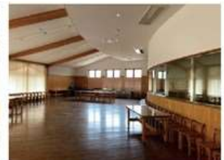
調理設備も充実した広いランチルーム