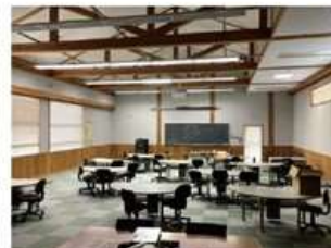
インフラが整備されたコンピューター室

小学校ならではの「音楽室」「理科室」「調理室」「体育館」など電気・水道・ガス、また吸音・防音などが充実したインフラ設備や、室内は北山杉がふんだんに貼られており、建築物としての評価も高く、まだまだ活用できる校舎。この校舎の目の前に新校舎(小中一貫校)が完成します。