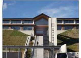
京都京北小中学校