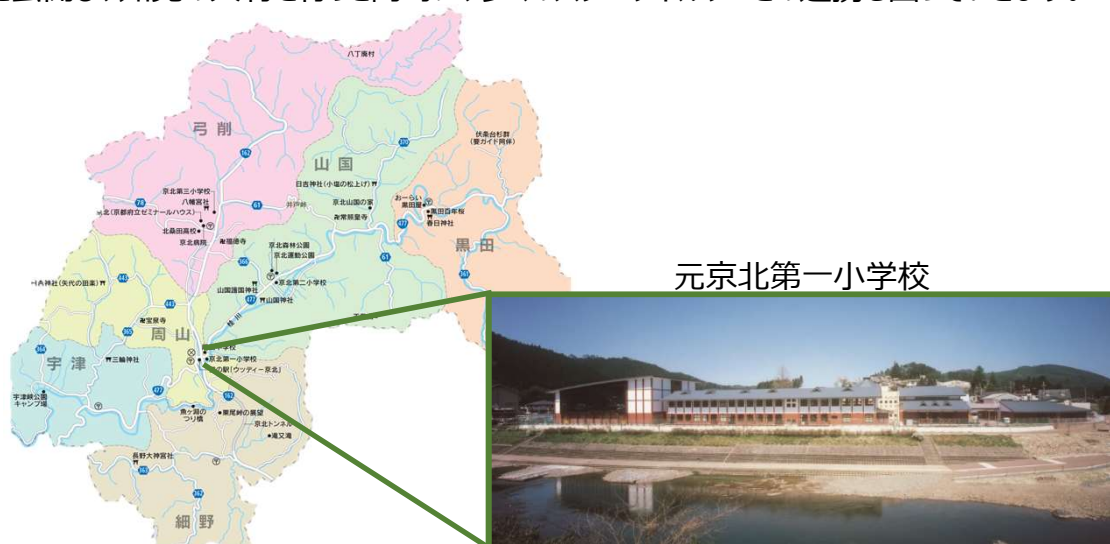
京都里山SDGsラボ運営協議会

SDGs・持続可能性に挑戦する全国の中山間地域のモデルとして、2030年を視野に、2025年大阪・関西万博やSDGs未来都市ネットワークなど、日本や世界が注目する場において、プロセスやツールを公開し、知見の共有を行うと同時に、多くのステークホルダーとの連携も図っていきます。