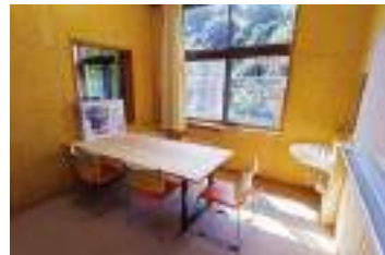
オフィス以外にも、共用で使えるミーティングルームを各階に完備。