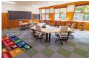
シェアオフィスの一例(サイレントルーム)。 Wi-Fiや北山丸太を使ったデスクを完備。