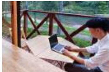
1階の各オフィスにはデッキスペースがあり、山や川を眺めながらの仕事も可能。