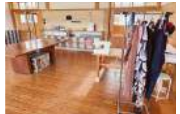
手芸や木工が可能なアップサイクルファブラボ。イベントなども定期的に開催。