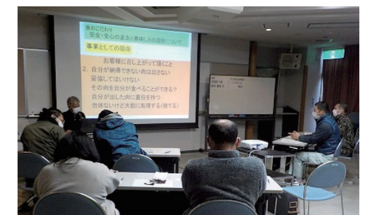
1月27日に開催された勉強会の様子

皆様にも、自然のなかで育ったシカ肉のおいしさや健康面での良さを、もっと知ってもらいたいと思っています。