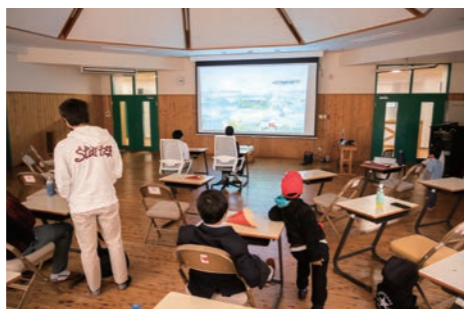
カラオケ&ゲーム大会 @スタジオ