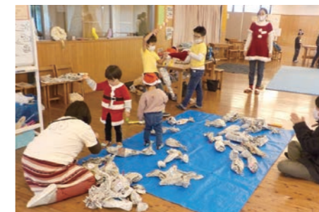
魚釣りゲームを楽しむ