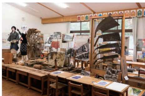
京都里山めぐる展 @アップサイクルギャラリー