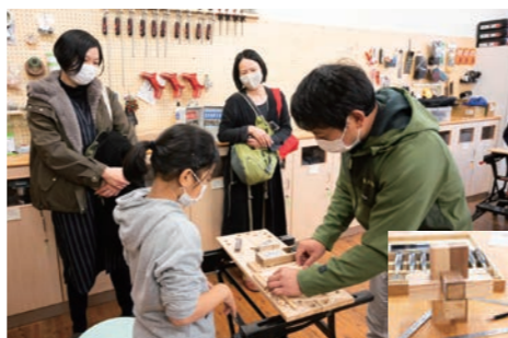
立体パズル&箸づくり(木工ラボ) @アップサイクルファブラボA