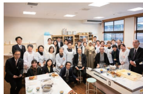
クロモジスイーツ作り @キッチンラボ