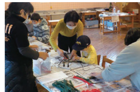
家族でクリスマスリース作り