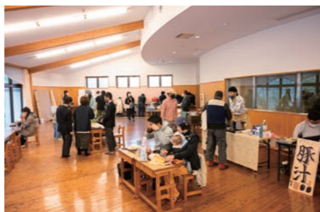
ことす食堂 飲食ブース @ランチルーム