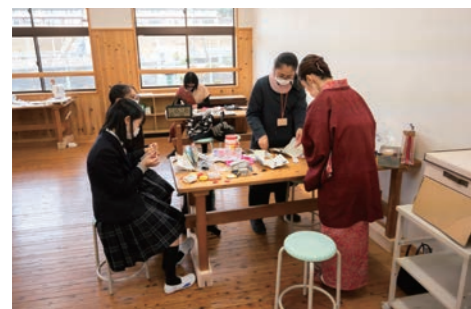
つまみ細工(手芸ラボ) @アップサイクルファブラボB