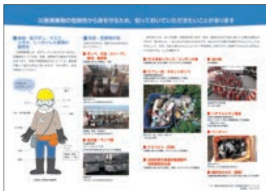
▲危険・有害なものを知る

◆家や地域でも、避難訓練やイメトレをする ▼防災前後に正しく行動することで、火災を減らし、災害ごみを減らすこともできます。学校での避難訓練や、ガイドブック( )を参考に、