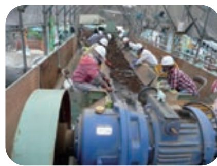
東日本大震災における「災害ごみ」の分別リサイクルの例

「災害ごみ」って何? 今年元旦に能登半島地震が起こりました。まず、被災された方にお見舞い申し上げます。 京都でも揺れを感じた人が多いのではないのでしょうか? 日本は災害大国です。いつ、どこで、どんな災害が起こっても不思議ではありません。災害によって、様々な被害が出ますが、今回は「災害ごみ」について考えてみましょう。