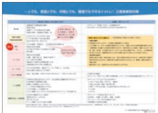
▲家や地域でも、避難訓練やイメトレをする