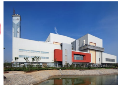
▲中国の青島で手掛けた清掃工場

■連絡先 人事部採用グループ TEL:045-505-7457 E-mail:recruit-jinj@jfe-eng.co.jp