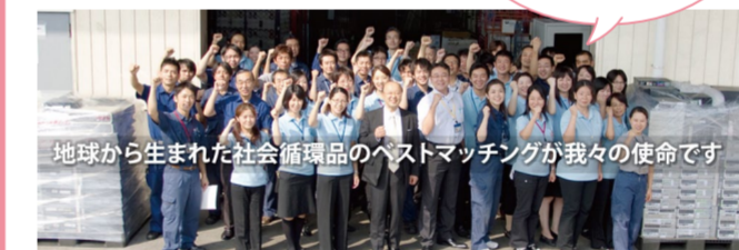
▲社長を中心に、熱く元気な仲間達です！