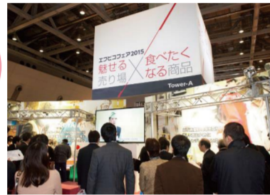
▲「エフピコフェア」は今年も東京ビッグサイトで開催！