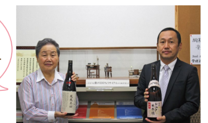
▲社長と副社長が参加します！